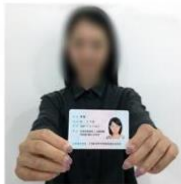
(手持身份证照片示例)