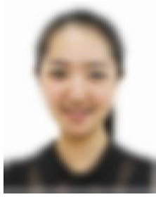
(证件照标准示例照片)

①仅支持 jpg 或 jpeg 格式，建议大小不超过 10M，宽高比例 3:4；