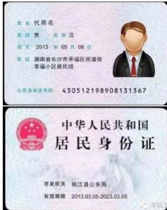
(身份证正反面示例)

2. 本人身份证人像面、国徽面照片，请确保身份证边框完整，字迹清晰可见，亮度均匀，文字正向显示。